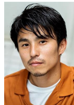
中尾 明慶 Akiyoshi Nakao

1988年東京都生まれ。2001年に「3年B組金八先生」でデビュー。その後「GOOD LUCK!!」、「ドラゴン桜」、「ROOKIES」（TBS）など、数々の人気作品に出演し注目を浴びる。近年の出演作には「監察医 朝顔」（CX）、「ボクの殺意が恋をした」（NTV）、「卒業タイムリミット」（NHK）、映画「キャラクター」、「仮面ライダー ビヨンド・ジェネレーションズ」、「ウェディング・ハイ」など。YouTube チャンネル「中尾明慶のきつねさーん」では週2回のペースで配信中。