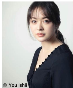
貫地谷 しほり Shihori Kanjiya

1985年12月12日生まれ、東京都出身。2002年映画デビュー。2004年の映画「スウィングガールズ」で注目を浴び、2007年に連続テレビ小説「ちりとてちん」（NHK）で初主演を務める。2013年の初主演映画「くちづけ」では第56回ブルーリボン賞主演女優賞を受賞。テレビ、映画、舞台など、さまざまな分野で幅広く活躍している。