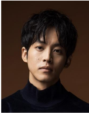
松坂 桃李 Tori Matsuzaka

2009年「侍戦隊シンケンジャー」で俳優デビュー。以降、映画、ドラマ、舞台と幅広く出演。2019年「孤狼の血」で日本アカデミー賞最優秀助演男優賞、2020年「新聞記者」で日本アカデミー賞最優秀主演男優賞を受賞。その他の近年の主な出演作に「あの頃。」「いのちの停車場」「孤狼の血 LEVEL2」「空白」「流浪の月」など。待機作に「耳をすませば」（2022年10月14日公開）、Netflix シリーズ「離婚しようよ」（2023年配信）がある。