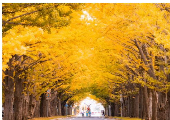
北大イチョウ並木