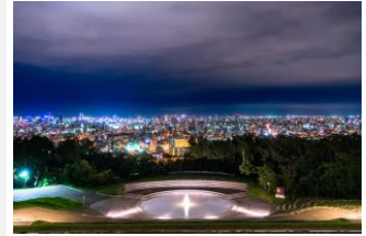
旭山記念公園

市電路線の西側に広がる幌西・伏見エリアに位置する「西線11条」駅、「西線16条」駅。中央区内だが、旭山記念公園や藻岩山の緑とゆったりとした雰囲気がある街だ。都心に近い「西線11条」駅は「不動産の資産価値が高そう」（3位）という点も街の魅力。札幌市中央図書館や、文化芸術を通して地域の交流を育む「あけぼのアート&コミュニティセンター」も近く、29位からジャンプアップした「西線16条」は、街の魅力の6位に「魅力的なコミュニティセンターや公民館がある」が入っている。