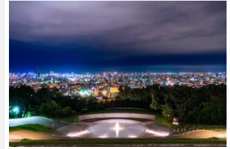
旭山記念公園

市電路線の西側に広がる幌西・伏見エリアに位置する「西線11条」駅、「西線16条」駅。中央区内だが、旭山記念公園や藻岩山の緑とゆったりとした雰囲気がある街だ。都心に近い「西線11条」駅は「不動産の資産価値が高そう」（3位）という点も街の魅力。札幌市中央図書館や、文化芸術を通して地域の交流を育む「あけぼのアート&コミュニティセンター」も近く、29位からジャンプアップした「西線16条」は、街の魅力の6位に「魅力的なコミュニティセンターや公民館がある」が入っている。