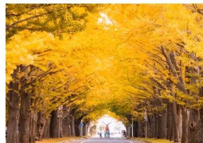
北大イチョウ並木