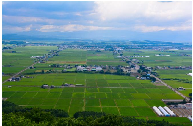
上川郡東川町の風景