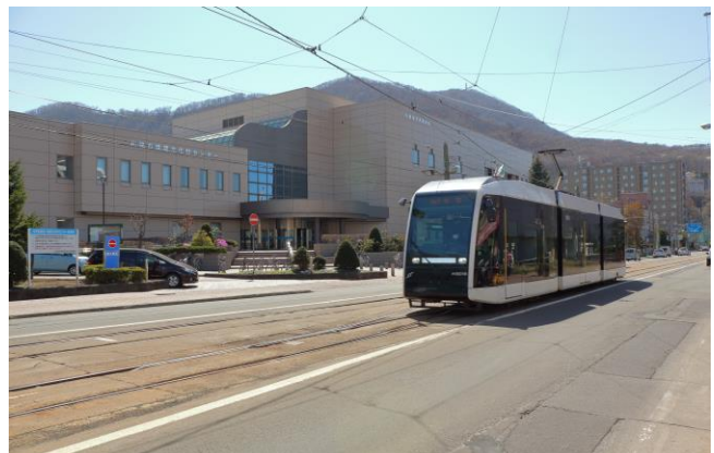
札幌市中央図書館と札幌市電車両