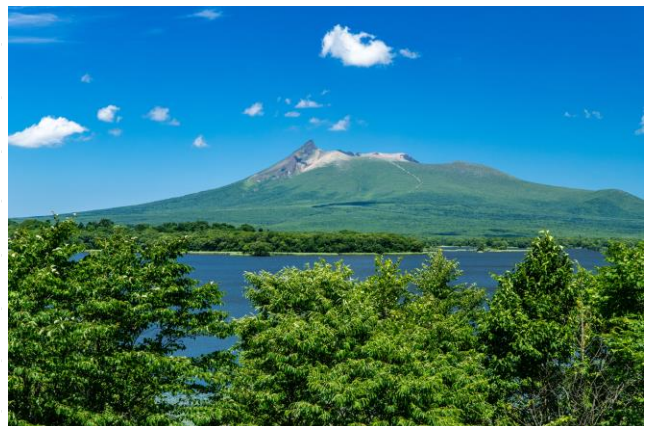
大沼や北海道駒ヶ岳がある大沼国定公園