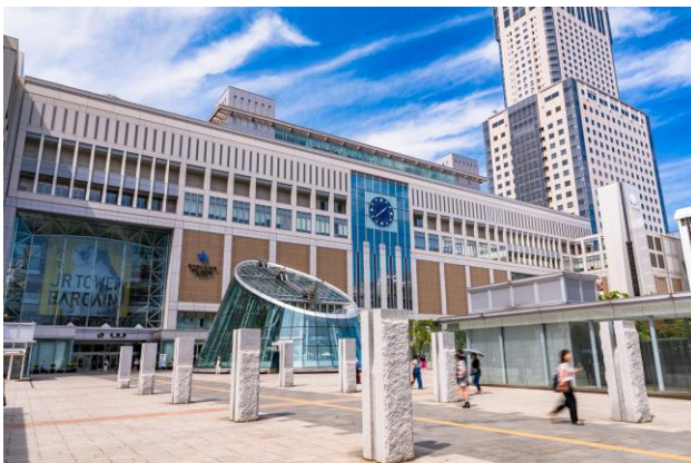
J R 札幌駅