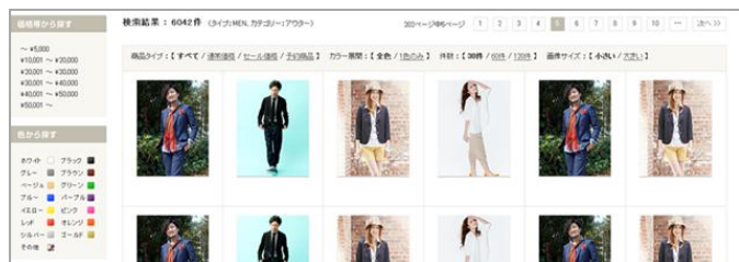
▲「コーディネートから探す」画面。気になるコーディネート詳細画面から、それぞれのアイテムに遷移でき購入できる。

④ファッション通販『ERUCA』サイトリニューアルを記念して、10月15日(月)まで送料無料