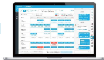
▲『Airシフト』のイメージ